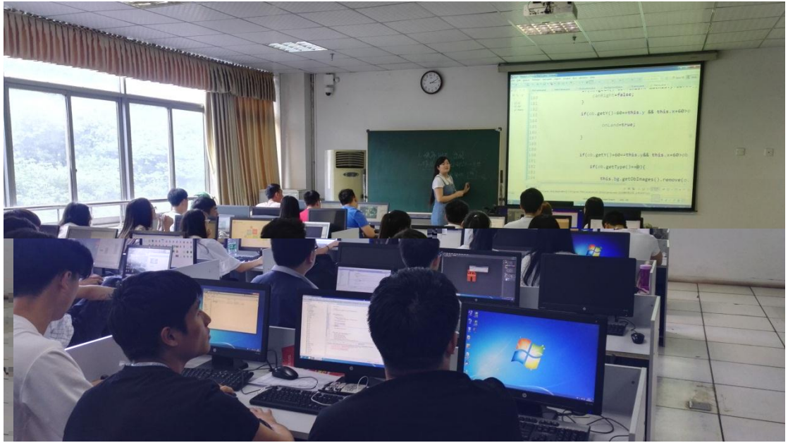
达内软件工程师授课